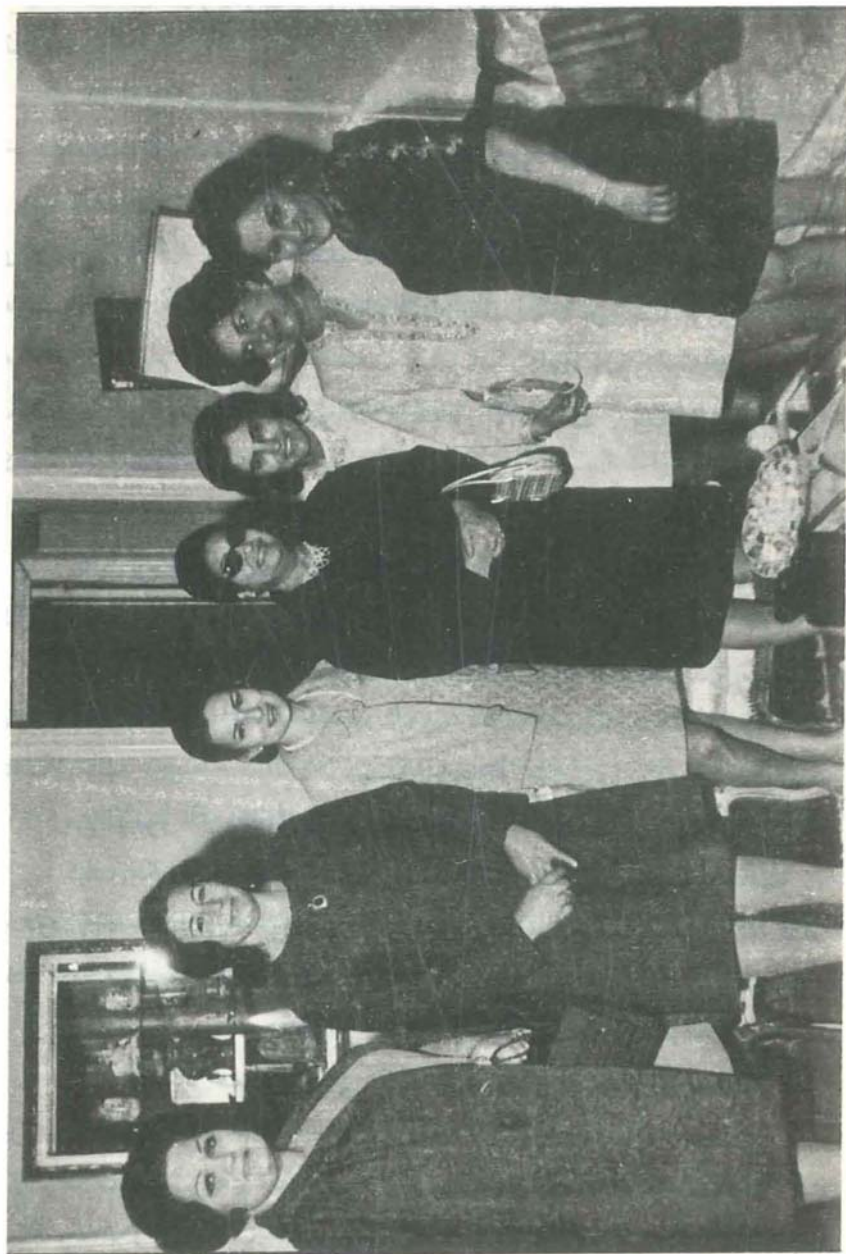
من لقاءات العمل النسائي في مصر - أم كلثوم تتوسط زوجات الدبلوماسيين العرب .

بعض صور اللقاءات النسائية في مصر - أم كلثوم تتوسط زوجات الدبلوماسيين العرب