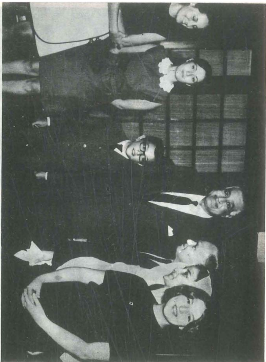
تمزية عبد الناصر بوفاء كحلل الدر وبعين . سكر