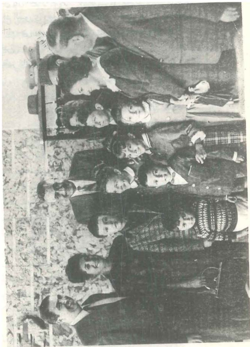
استقبال سامي وزوجته وأولاده للرئيس عبدالناصر في مطار بلقراة .