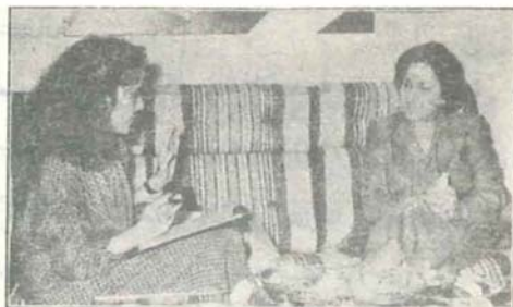
● احسان الدروبي تراسي لأحسان بن غالبه قباني