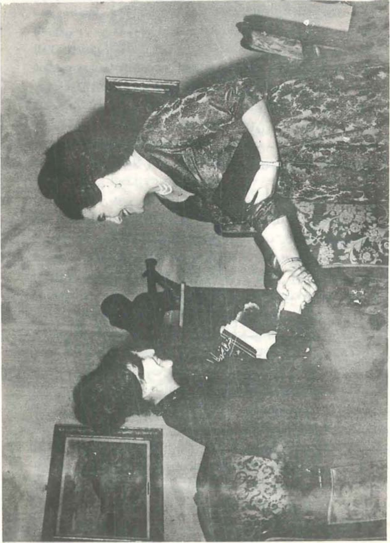
مع حرم الرئيس تينو