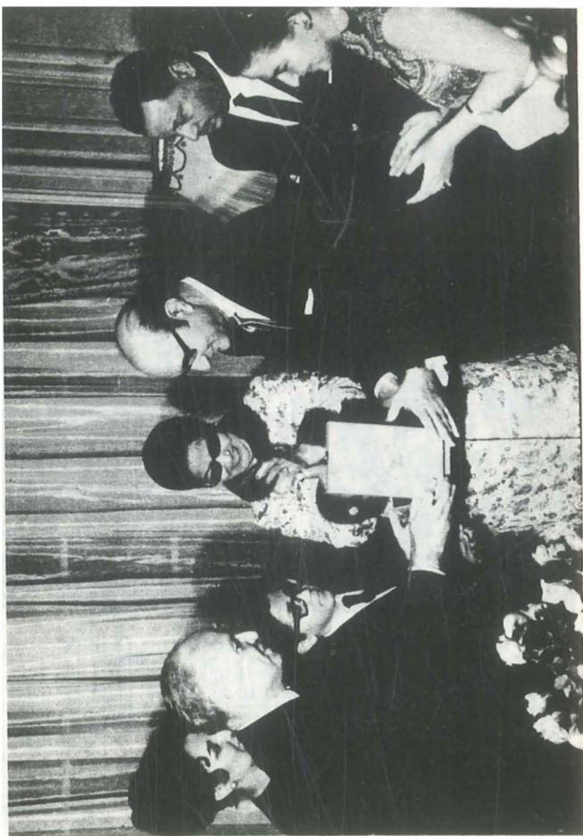
وسام سورية لمبدع الوهاب بحضور أم كلثوم

تم تكريمه من قبل سورية في حفل أقيم في دمشق في شهر كانون الثاني ١٩٥٢م