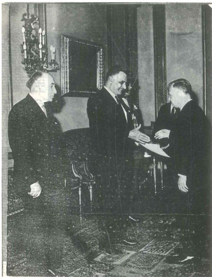
الدكتور الدروبي يقدم أوراق اعتماده لعبدالناصر .