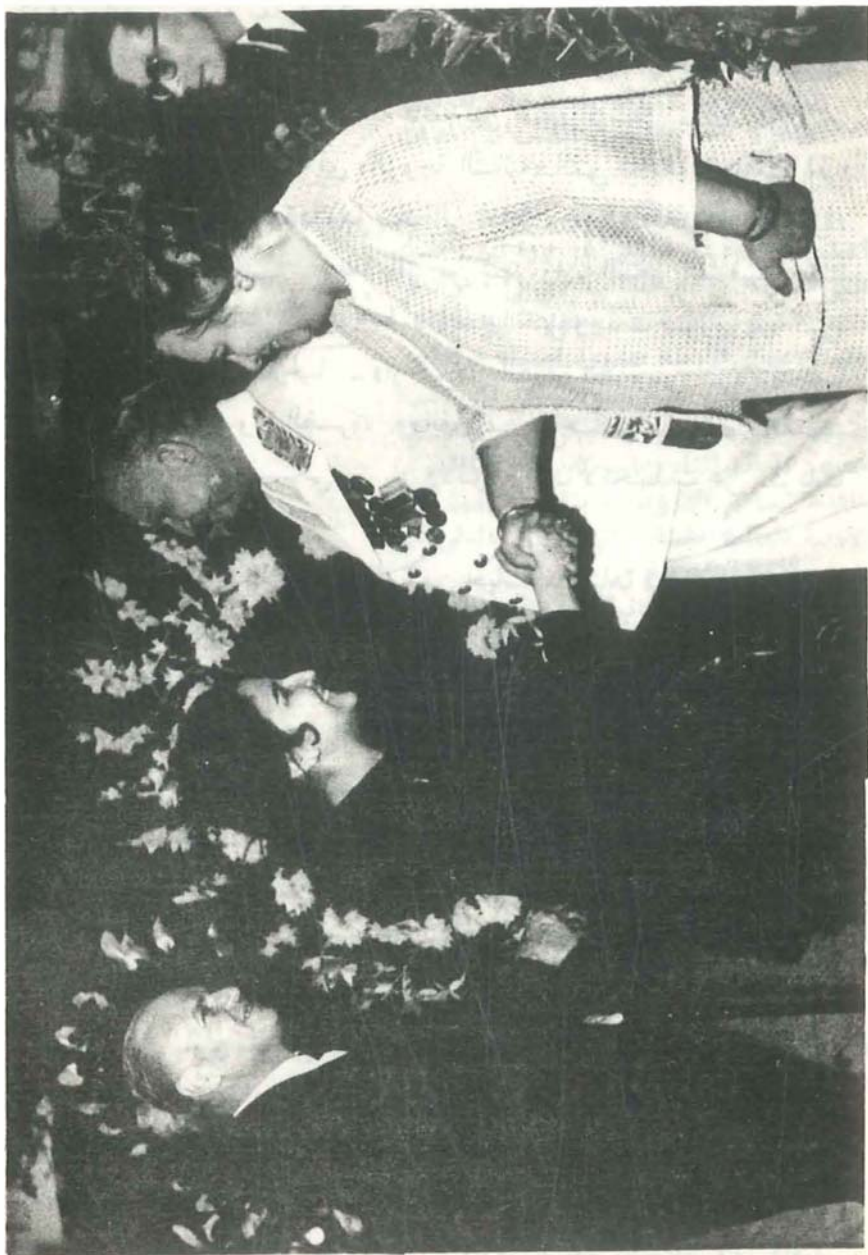
في منزل السفير السوفيتي فيتوهرادوف