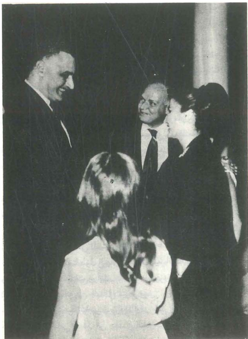
استقبال الرئيس عبدالناصر في دار الدروبي