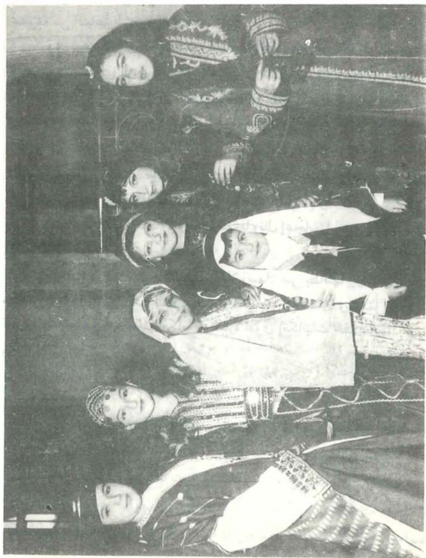
في حفل الازياء الشعبية السورية في بلغراد .