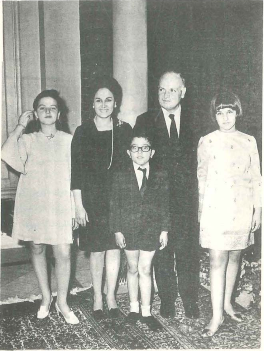
في انتظار وصول الرئيس عبدالناصر إلى دار الدروبي .