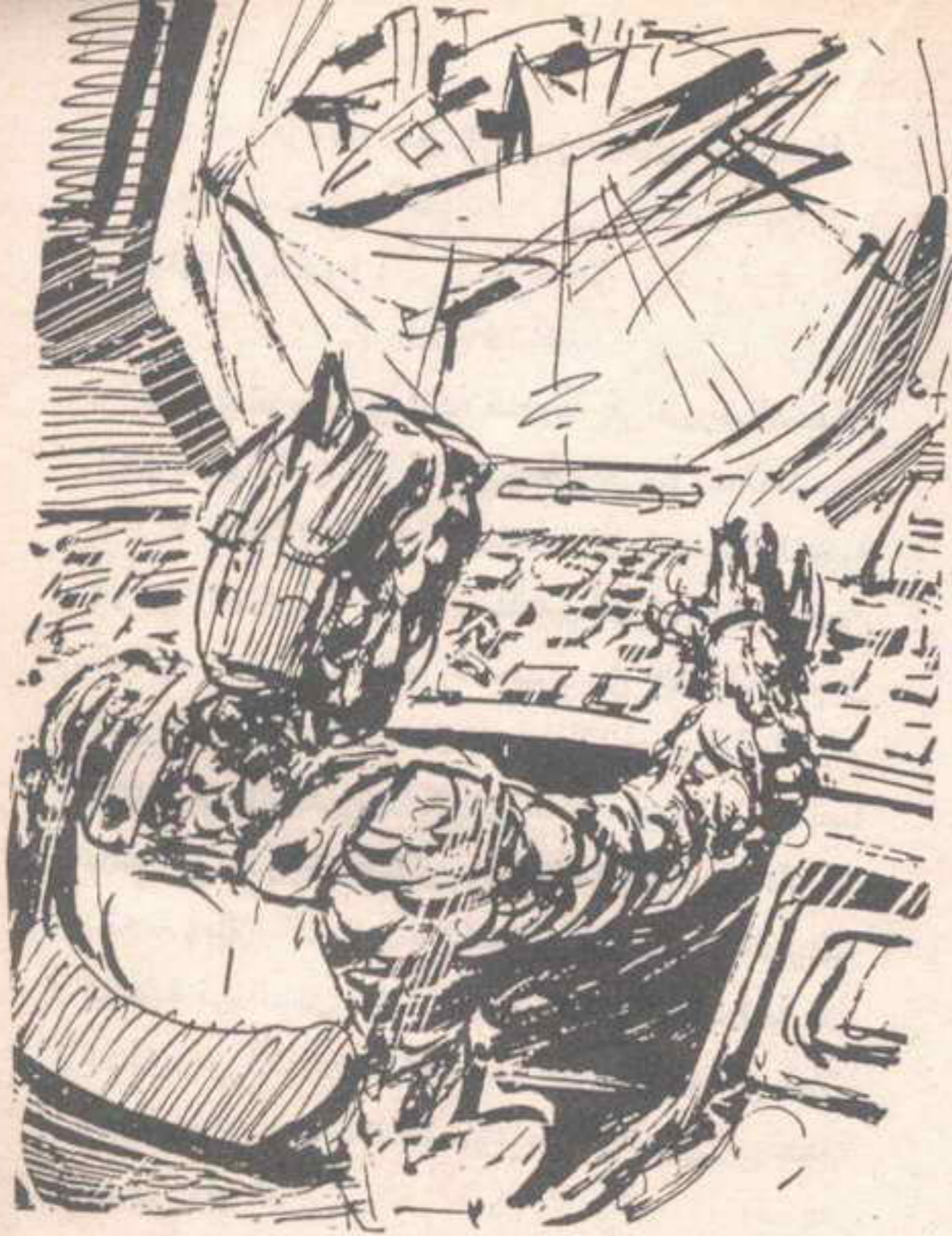
وقبل أن يبدأ الكائن عمله ، ضغط عددًا من الأزرار في جهاز كبير ، يشبه أزرار أجهزة الكمبيوتر الأرضية ..

وفي اللحظة نفسها ، اعتدل ذلك الكائن ، في الكهف المريخي ، وأدار عينيه الواسعتين إلى شاشة كبيرة ، تراصت فوقها حروف غريبة ، بلغة لا مثيل لها على كوكب الأرض ..