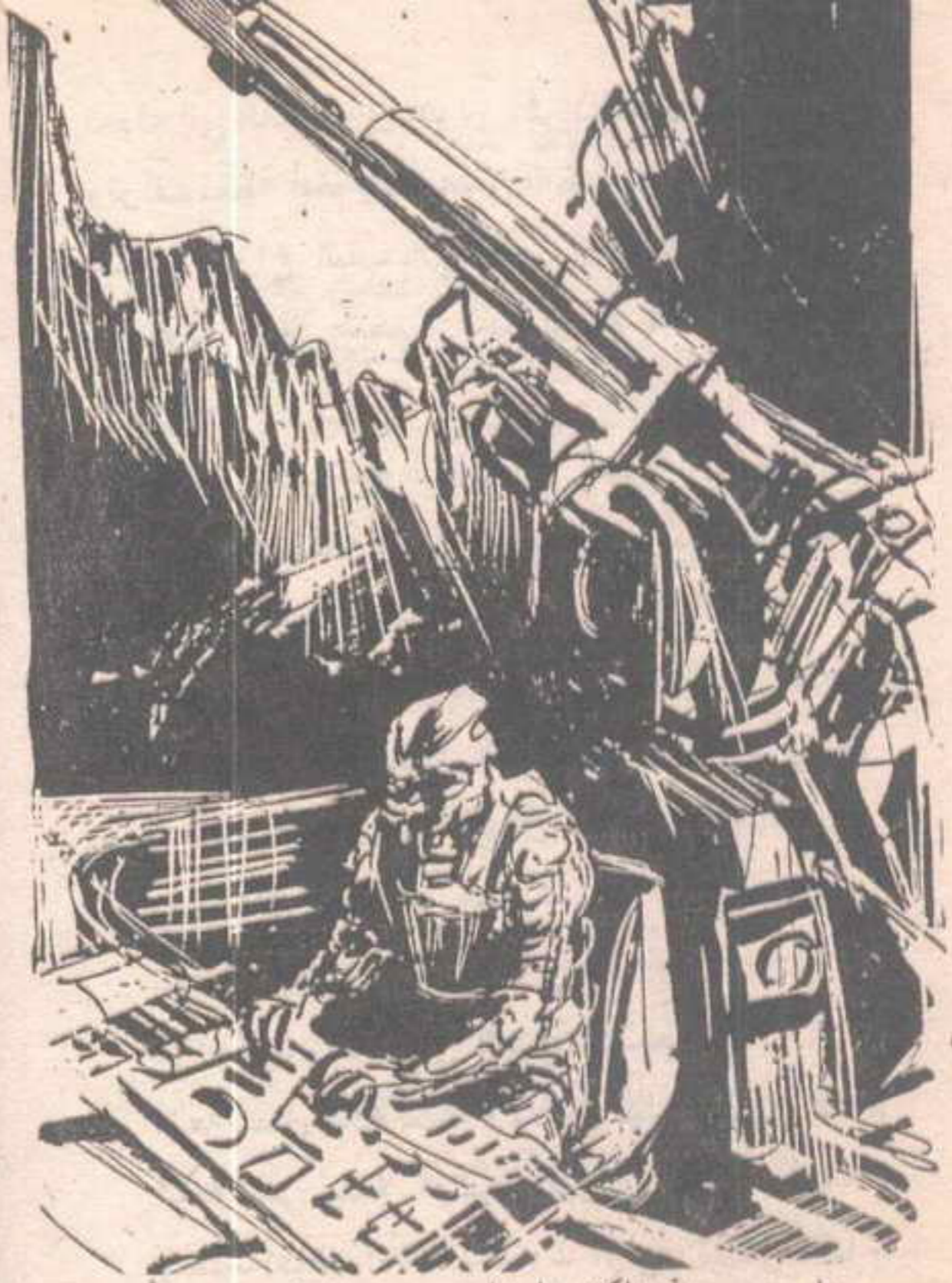
وفي حسم ، اتجه الكائن إلى الجهاز ، وضغط زرًا فيه ، فانسحقت قمة الجبل في هدوء ، لتبدو من خلفها السماء المريخية الحمراء .

انفجار هائل ، تبلغ قوته عشرة أضعاف قوة القنابل الذرية ، أطاح بالجبل كله ، بكل من فيه من الكائنات المريخية ، وكل ما يحويه من أجهزة وأسلحة ..