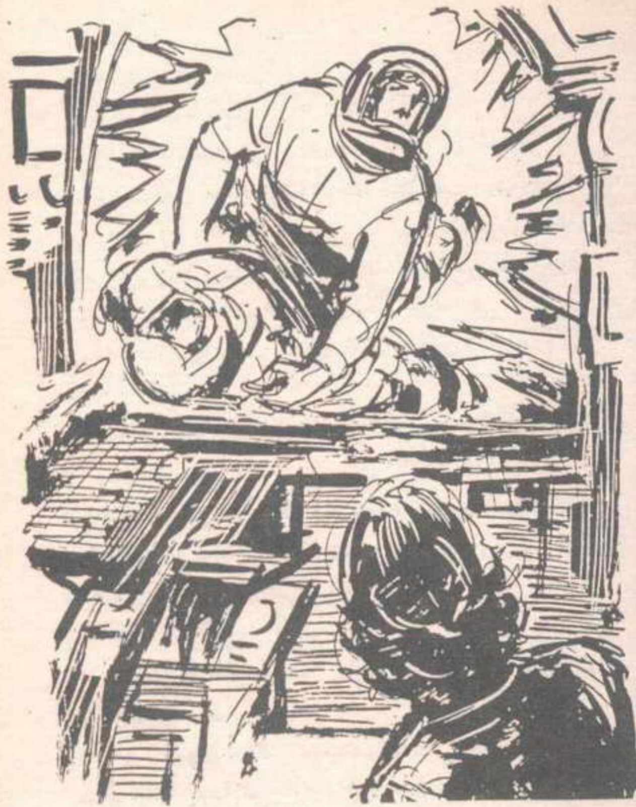
عاد ( نور ) أدراجه إلى النافذة المحطمة ، ودفع جسد (أكرم)