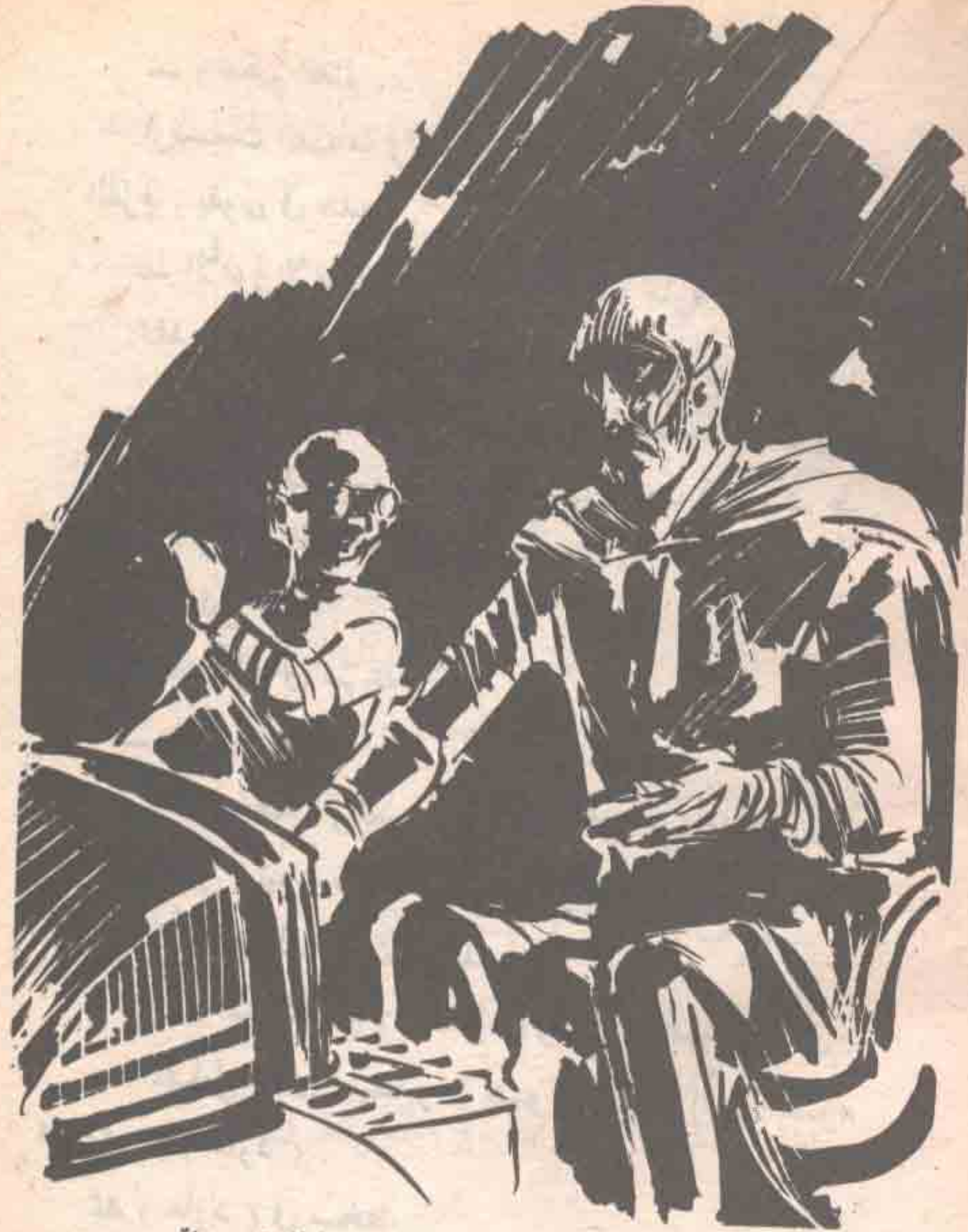
جلس ( أمير الظلام ) النحيل في حجرته المظلمة ، يراقب شاشة راصدة في اهتمام بالغ ..