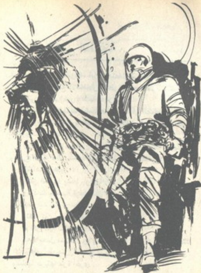
ودوت فرقة عنيفة داخل الحجره : والدفع جسد ( ميرفى ) خارجها كقذيفة مدفع ..

وفي انهيار ، خفض (ميرفى) مسدسه ، هاتفاً : - لا .. لا تقتلنى .. اننى أنتظر استسلام الأرض .. بعد ثمان دقائق فحسب ، سيسحق مدفع الليزر مقار الرئاسة الخمسة ، وستستسلم الأرض بعدها حتماً .. أنا سأصبح أول إمبراطور ، بحكم كوكبنا بأكمله ..