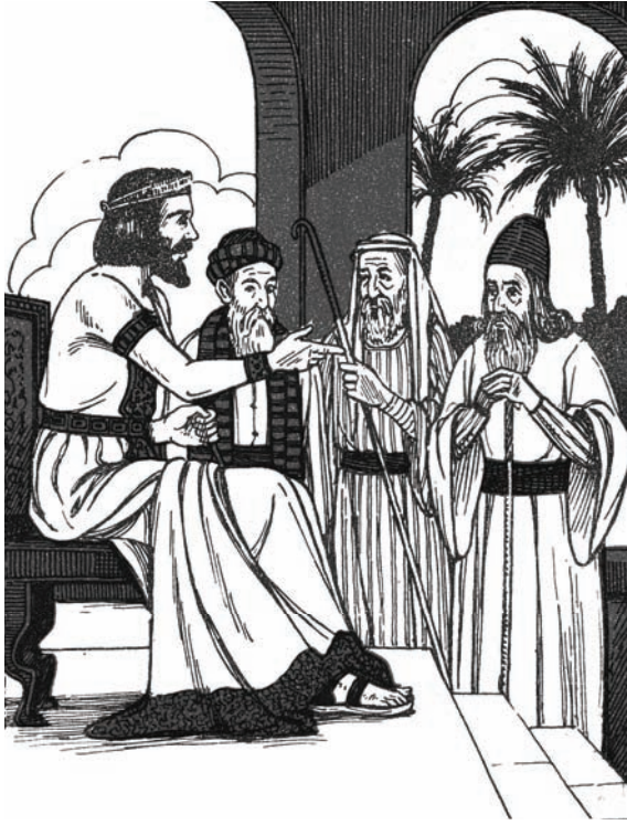
الْمَلِكُ يُقْضِ رُؤْيَاهُ، وَالْعُرَفَاءُ أَمَامَهُ يَسْتَمِعُونَ.

أَنْ تُشِيرُوا عَلَيَّ بِمَا يَجْتَمِعُ عَلَيْهِ رَأْيِكُمْ، إِنْقَادًا لِبَلَدِنَا. لَا يَنْبَغِي أَنْ نَقِفَ مَكْتُوفِي الْأَيْدِي إِزَاءَ ذَلِكَ، فَتَسُوءَ حَالُنَا.» أَقْبَلَ جُلَسَاءَ الْحَاكِمِ عَلَى كَبِيرِ الْعُرَفَاءِ يَتَشَاوَرُونَ مَعَهُ فِي الْأَمْرِ. قَرَّ رَأْيُهُمْ عَلَى أَنْ يَأْمُرَ الْحَاكِمُ بِنَاءِ مَخْرَنٍ كَبِيرٍ عَلَى الْفُؤْرِ. فِي هَذَا الْمَخْرَنِ يُدْخَرُ كُلُّ عَامٍ نِصْفُ مَا تُنْتَبِئُ الْحُقُولُ. يَسْتَمِرُّ ذَلِكَ خِلَالَ السَّنَوَاتِ السَّبْعِ، الَّتِي هِيَ سَنَوَاتُ الرَّخَاءِ. هَذَا الْمَدَّخَرُ يَبْقَى زَادًا يَنْقَوْتُ بِهِ الشَّعْبُ، خِلَالَ الْأَعْوَامِ الشَّدَادِ. لَمْ يَلْبِثِ الْحَاكِمُ أَنْ أَقَرَّ