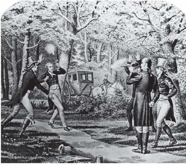
شكل ٢-٢: انتهت المنافسة السياسية المحتمدة بين آرون بير وألكسندر هاملتون بمبارزة في ويهوكن بولاية نيو جيرسي في ١١ يوليو ١٨٠٤.

الأحزاب كانت أحزابًا هشة وغير ناضجة، ولم يُتَح للناس وقت كي ينمو لديهم شعور بالولاء لحزب ما كمؤسسة، بل كان ولاؤهم للزعماء. ولم تكن النخبة السياسية منقسمة حيال كل القضايا، وقد قال جيفرسون في خطبته التي ألقاها يوم تنصيبه: «ليس كل خلاف في الرأي خلافًا في المبدأ ... كلنا جمهوريون وكلنا فيدراليون». وكانت ولاءات المرشحين للمنطقة الجغرافية أكثر منها للحزب. وقد اعتاد جيفرسون إبان رئاسته إقامة حفلات عشاء منظمة بعناية لتملق أعضاء الكونجرس لتأييد أفكاره. ولما أخفقت قيادات الحزب الفيدرالي في الاستجابة للسخط الشعبي على أفكارهم، ولم يكن هناك تنظيم حزبي راسخ يدعم الحزب، انزوى القادة في بيوتهم واختفى الحزب.