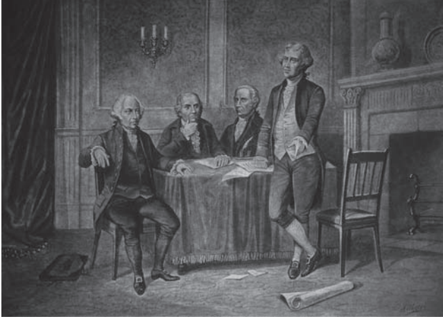
شكل ١-٢: كان جون آدمز وجوفرنور موريس وألكسندر هاملتون وتوماس جيفرسون، زعماء الجمهورية الأمريكية السياسيون في مستهل نشأتها، من مؤسسي أول حزبين سياسيين في أمريكا.