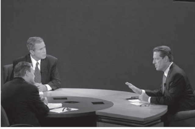
شكل ٥-٣: رئيس الجلسة جيم ليهير وجورج دبليو بوش يستمعان للمرشح الديمقراطي آل جور فيما يجيب عن سؤال خلال المناظرة الرئاسية في كنيسة ويت بجامعة ويك فورست في أكتوبر ٢٠٠٠. (Wait Chapel, NC, Wake Forest University)

ستنفق أموال طائلة في الانتخاب العام. نحن نعرف أن الحزبين سيتلقيان تمويلًا حكوميًا بعشرات الملايين، لكن ما لا نعرفه هو ما إذا كان المتسابقان سيقبلان التمويل الحكومي أم سيخوضان الانتخابات باستخدام أموال خاصة، ومن ثم يتجنبان أي قيود على الإنفاق. ونحن نعرف أن الحزبين السياسيين الكبارين وآخرين سيساهمون أيضًا، لكننا لا نعرف كيف سيفعلون ذلك، وكم سينفقون، وما سيكون لذلك الإنفاق من أثر. أخيرًا، نحن نعرف بشيء من اليقين أن ما يزيد قليلًا عن نصف الناخبين المؤهلين سيدلون بأصواتهم على أكثر تقدير، وهي نسبة ضعيفة إذا أخذنا في اعتبارنا أن نحو ٧٥ في المائة من الناخبين المؤهلين في المتوسط يدلون بأصواتهم في الديمقراطيات الأشد حداثة، حتى مع استبعاد الديمقراطيات التي يكون التصويت فيها إلزاميًا. وبينما يشير المواطنون في الولايات المتحدة إلى ديمقراطيتهم باعتزاز، وبينما يعمل رئيس الجمهورية دأبًا على تصدير الديمقراطية الأمريكية، فلا ريب أن بعض جوانب النظام تخفق في بلوغ المثل الأعلى الذي ينبغي أن تناضل لبلوغه أي ديمقراطية فعالة بحق.