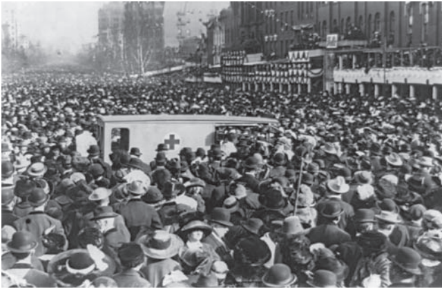
شكل ٢-٥: مسيرة مؤيدة لحق المرأة في الانتخاب تشق طريقها عبر شوارع واشنطن العاصمة في ٣ مارس ١٩١٣. وقد ترتب على توسيع حق الانتخاب تضاعف عدد الناخبين.

مقصوداً على نحوٍ واحدٍ فقط من أصل ثلاثين، وكانت السياسة مهنة النخبة، فلم تكن هناك حاجة تُذكر إلى أخذ وجهات نظر الإنسان العادي بعين الاعتبار، لكن توسيع حق الانتخاب ليشمل دافعي الضرائب كافة أحدث تغييراً جوهرياً في اللعبة، ومع تغيُّر اللاعبين، اضطر من ينشدون الانتخاب إلى تبني استراتيجيات جديدة أو الاندثار كما في حالة الفيدراليين.