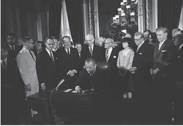
شكل ١-٢: الرئيس ليندون جونسون يوقع على تشريع حقوق التصويت لسنة ١٩٦٥ ليصير قانونًا.

على تقييد المنافسة وضمان النتيجة الحزبية المنشودة. وقد طُعن في التقسيم الانحيازي للدوائر (ترسيم الحدود بغرض تحقيق ميزة حزبية صريحة) في دعاوى قضائية أقيمت أمام المحكمة العليا ادعى فيها رافعوها انتهاك حقوقهم في التمثيل المتساوي، لكن المحكمة لم تحظر هذا التقسيم الانحيازي للدوائر الذي يتهمه كثيرون بالتسبب في غياب المنافسة عن الانتخابات التشريعية، أو على الأقل في بعض الولايات الأكثر كثافة بالسكان.