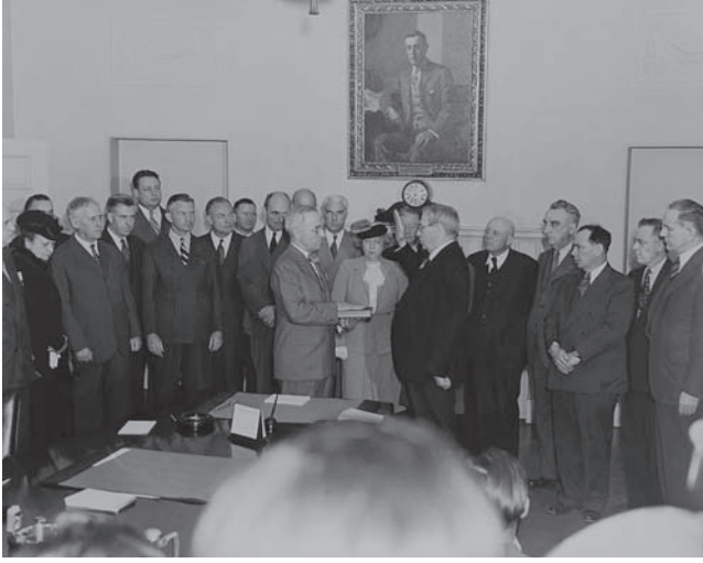
شكل ١-١: هاري إس ترومان يحلف اليمين الدستورية كرئيس للولايات المتحدة الأمريكية في قاعة مجلس الوزراء بالبيت الأبيض عقب وفاة الرئيس روزفلت في أبريل ١٩٤٥.