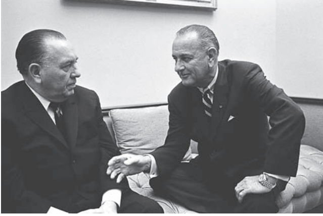
شكل ٢-٤: الرئيس ليندون جونسون يقدم فروض الولاء للزعيم السياسي العريق بشيكاغو العمدة ريتشارد دالي.

ربما فقد الناخبون الحوافز المادية لمساندة حزب أو آخر، لكن ولاءهم ظل كما هو، وكان الانقسام الحزبي إبان الخطة الاقتصادية الجديدة عميقاً للغاية، حيث كان الديمقراطيون يرون في الرئيس روزفلت مُخلصاً، بينما كان الجمهوريون يرون فيه شيطاناً. وتسامى ولاء الناخبين لأحزابهم فوق الخلافات وفوق الشخصيات، فيما عدا في حالة الزعماء ساحري الجماهير كالجنرال دوايت دي أيزنهاور عندما ترشح للرئاسة في ١٩٥٢، وظلت التنظيمات الحزبية قائمة، لكن قوتها زالت. ٩