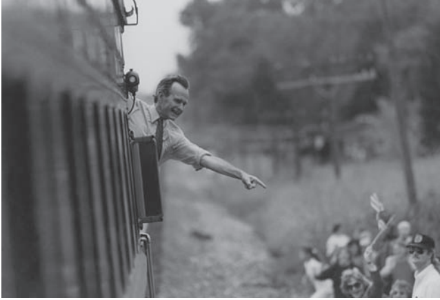
شكل ٥-٢: الرئيس جورج إتش دبليو بوش يلوح من مؤخرة القطار على مشارف مدينة بولينج جرين في رحلة انتخابية بالقطار عبر ولاية أوهايو في سبتمبر ١٩٩٢.

الحملة، وكم من الجهد يكرسون، ولأي ولاية، وهي قرارات تخضع للموارد المتاحة، والقواعد المعمول بها في كل ولاية، وأيديولوجية المتسابق والناخبين في كل ولاية، وجدول مواعيد الأحداث.