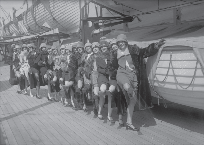
شكل ١-٢: كانت عضوات فرقة تيلر جيرلز يرقصن في أنماط هندسية منسقة بإحكام، بدا أنها تعكس الإدارة والتنميط المتزايدين للمجتمع الحديث.

القوة المتزايدة للشكل السلعي في مجموعة مقالاته التي ظهرت باسم «الأدب والثقافة الجماهيرية» (ونُشرت عام ١٩٨٤). كما قدم تحقيقاً اجتماعياً رائعاً عن ظهور العقلية البرجوازية من خلال شخصيات أدبية مهمة في مؤلفه «الأدب وصورة الإنسان» (نُشر عام ١٩٨٦).