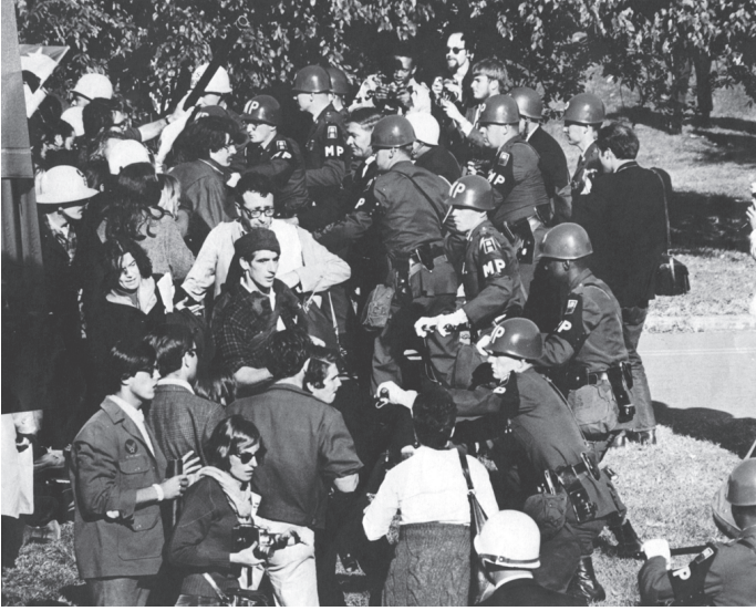
شكل ١: تأثر المفكرون الراديكاليون من بين حركات ستينيات القرن العشرين الطلابية تأثرًا عميقًا بالنظرية النقدية ومدرسة فرانكفورت.

النقدية. غزت مناهج تفكيكيةً وما بعد بنوية أشهر الدورات وأهم التخصصات، بدايةً من الأنثروبولوجيا والأفلام وحتى الدين واللغويات والعلوم والسياسة. وقد أنتجت رؤى عميقة جديدة حول العرق والنوع وعالم ما بعد الاستعمارية. لكن، في خضم ذلك، فقدت النظرية النقدية قدرتها على تقديم نقد متكامل للمجتمع، ووضع تصور لسياسات هادفة، وطرح مُثُل جديدة للتحضر. كما حوّل تفسير النصوص والاهتمامات الثقافية والنزاعات الميتافيزيقية النظرية النقدية تدريجيًا إلى ضحية لنجاحها؛ فكانت النتيجة أزمة هوية دائمة.