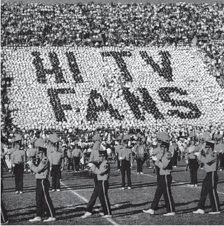
شكل ٦-١: الإذعان وفقدان الفردية يميزان الوعي السعيد.

المجتمع البالغ القوة؛ باستطاعة كل فرد أن يكون سعيدًا، فقط إذا كان سيُذعن تمامًا ويُضحّي بحقه في السعادة.