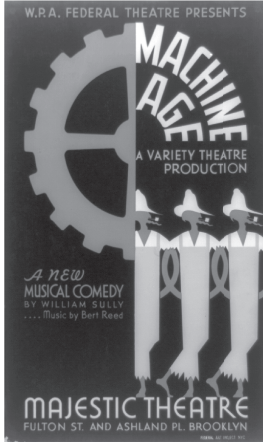
شكل ٣-١: الاغتراب والتشيؤ يدْمُران الذاتية ويحوّلان العامل إلى إحدى تكاليف الإنتاج.

زادت كتابات ماركس الشاب من احتمالات حدوث حركات ثورية؛ فالبؤس الذي تعانيه البشرية هو المستهدف من التحرك الراديكالي، رغم أن الرأسمالية تزيد هذا البؤس على نحو كبير. إن لكل من البيروقراطية والمال والتفكير الأداتي جذوره الأنثروبولوجية، حتى وإن كانت العملية الإنتاجية الجديدة تعزز هيمنة تلك العناصر. فمنذُ زمان سحيق