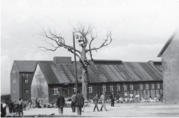
شكل ٤-١: تمتد جذور الفاشية إلى عصر التنوير. وتُظهر الصورة الموضحة شجرة البلوط المحببة لجوته في معسكر اعتقال بوخنفالده النازي.

لم يكن اهتمام هوركهايمر وأدورنو منصباً فقط على الحقيقة التجريبية المتمثلة في أن الشمولية قد نشأت من رَجْم نظام ليبرالي مثل جمهورية فايمر. وكانا مقتنعين بأن الفاشية نَتَجَّت عن الأحوال التي كانت قائمةً قبل فوزها، ليس كنتاج سلبي، وإنما كاستمرار فعلي لتلك الأحوال التي أنكرتها علانيةً (ونفاقاً)، وخان الإطار الأداتي الأفكار الليبرالية التي كانت موضوعة فيه؛ فتقويضه للضمير قد صار لأسوأ حال بفعل المُثُل التي كان من المفترض أنها تُبَرِّر وجوده. وكان اليهودي هو الأشدَّ معاناةً، وذلك من الناحية الأنثروبولوجية؛ لأن الحضارة طالما وصفته بـ «الغريب»، ومن الناحية التاريخية لأنه شاع عنه أنه حامل شعلة الليبرالية والرأسمالية.