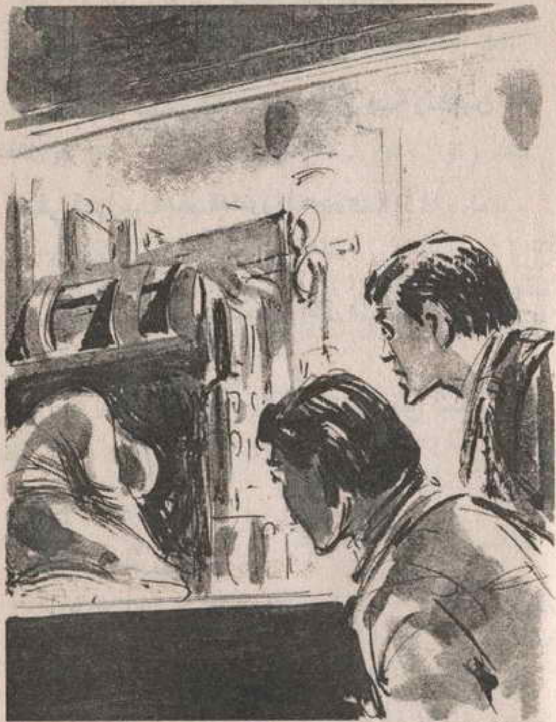
فهنالك ، وخلف ذلك الجهاز ، الذي يحتل أحد أركان الحجرة الزجاجية ، تكوّم جسد القاتل .