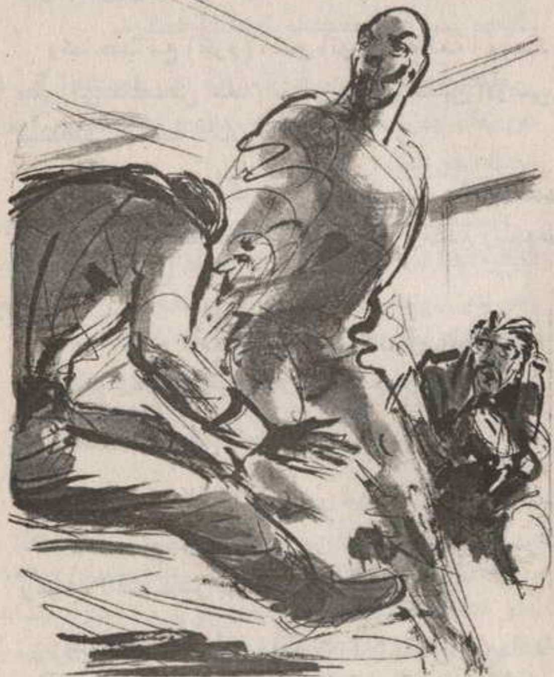
استدار إليه الطيف فجأة ، ورفع يده نحوه ، وهو يطلق صرخة شرسة صارمة ..