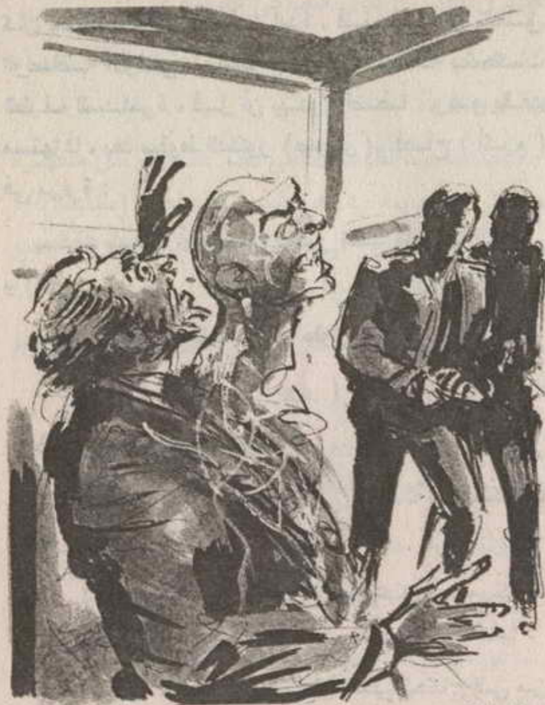
كان الدكتور (صبرى) يصرخ بالآلام رهيبه ، ويضرب بذراعيه فى الهواء ، فى ذعر وألم ، وذلك الطيف بداخله ..