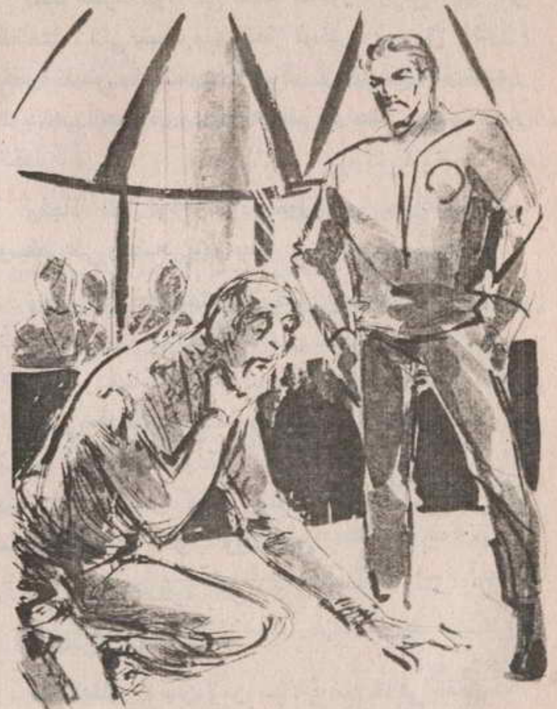
وفجأة ، اختل توازنه ، ودار حول نفسه ، وزاغت عيناه ، وسقط على ركبتيه وهو يطلق صرخة وحشية ..

- لست أدري ، هذا سيتوقف على درجة تماسك خلاياه ، بعد أن فقد الوعي .